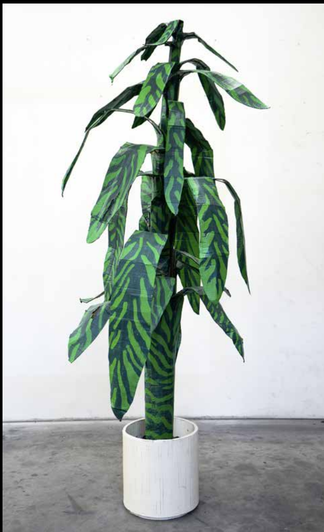
Prop, Diner, Big Green Plant · 2017 · Pappe, Farbe, Holz und Mixed Media · 230 × 130 × 110 cm