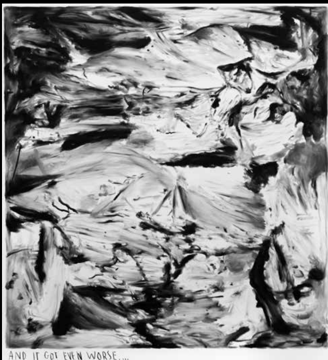
And it got even worse, ... · 2018 · Kohle auf Leinwand · Künstlerrahmen, 200 × 180 cm · Courtesy KÖNIG Galerie, Berlin

Cover: And now when the reason finally sleeps ... · Detail · 2018 · Kohle auf Lein- wand · Künstlerrahmen, 200 × 200 cm · Courtesy KÖNIG Galerie, Berlin