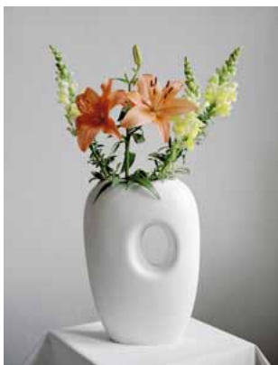
oben: Viktoria Binschtok »Gundam/Vase Cluster«, 2014, C-Prints, 100 × 83 cm/ 77 × 59 cm